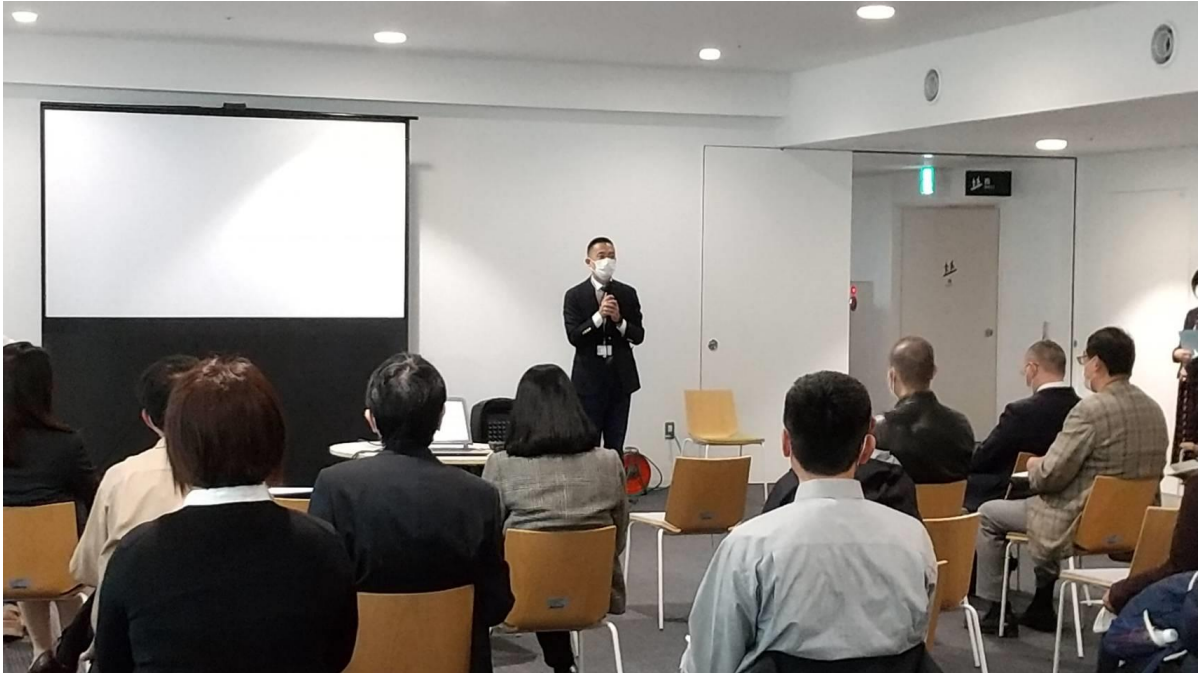
<渋谷区長：長谷部健様のご挨拶>