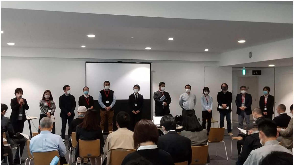
<参加 13 法人（14 施設）からの施設紹介>