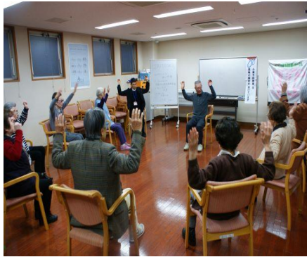
理学療法士による健康体操

バイタルチェック、理学療法士による骨折予防トレーニングを行い、栄養士による栄養レクチャー、季節ごとの創作活動・レクリエーション・頭の体操などを行なう。